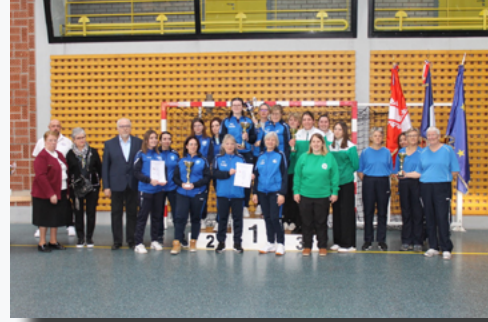
Les podiums Féminins et Masculins