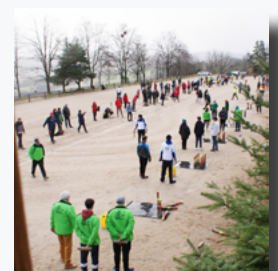
120 compétiteurs sur le terrain sénergouais

Les quatre triplettes Sénergouises ont globalement réussi cette manche : 4 victoires pour la triplette Carles, trois victoires et un nul pour la triplette Molénat et trois victoires et une défaite pour les triplettes Géraud et Vigouroux. A l'issue de cette journée, les Sénergouais restent au pied du podium puisqu'ils occupent les quatrième (Vigouroux), cinquième (Carles), sixième (Géraud) et douzième place (Molénat). Les trois équipes qui les précèdent, mènent un train d'enfer : l'équipe Gomez d'Argences en Aubrac avec 1 seule défaite sur 28 rencontres reste plus que jamais la grande favorite pour le titre 2023. Les équipes Galtier de Sébazac et Burguière de Bozouls occupent respectivement la deuxième et troisième place (24 victoires en 28 confrontations et un petit point d'écart entre les deux) et gardent un confortable matelas d'avance sur leurs poursuivants Sénergouais. A trois journées de la fin (et 11 confrontations), il faudra réussir une fin de saison exceptionnelle pour espérer, selon les autres résultats, venir se mêler à la lutte pour le podium. Cela commencera à Bozouls le 26 mars.