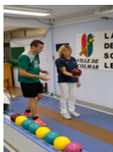
Ninepin bowling classic