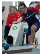
Ninepin bowling schere