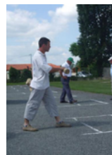
Quilles de 6