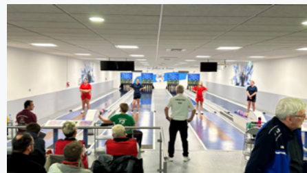
Vue sur les pistes avec joueurs et entraîneurs.

Comme tous les ans, la discipline a organisé une rencontre de présélection inter-régionale mixte de cadets et de juniors issus des CSR du Grand Est et de Bourgogne Franche-Comté. C'est ainsi que tous ces jeunes compétiteurs se sont retrouvés avec leur staff respectif le dimanche 4 décembre 2022 sur le quillier du Complexe Sportif de Beinheim dans le Grand Est. D'entrée les compétiteurs des deux régions ont fait valoir leurs ambitions et c'est au bout d'une rencontre âprement disputée et devant un public nombreux et enthousiaste que les quilleurs du Grand Est ont pris le dessus.